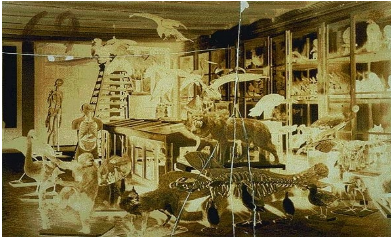
Le laboratoire du Pr Ameisenhaufen (négatif sur verre de 1927).