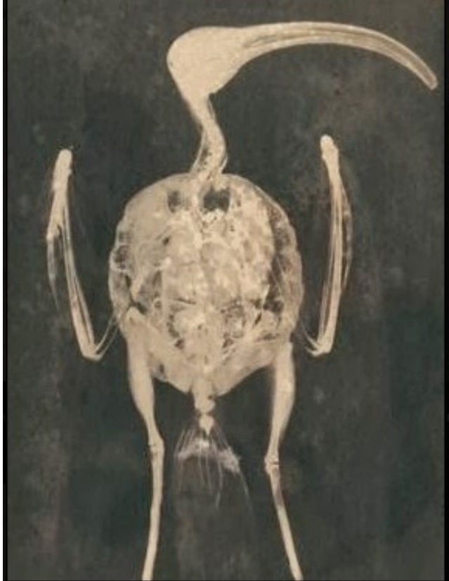
Treschelonia Atis : radiographie, fiche descriptive et animal naturalisé