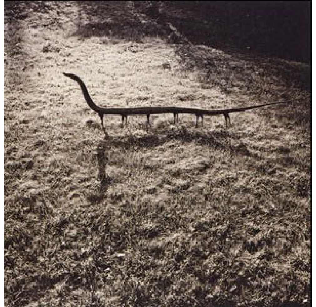
Alopex Stultus (photo du bipède poilu à tête de tortue, pouvant se camoufler verticalement comme un arbuste) et Solenoglypha Polypodida , Tamil Nadu, Inde (photo du serpent vertébré à 12 pattes).