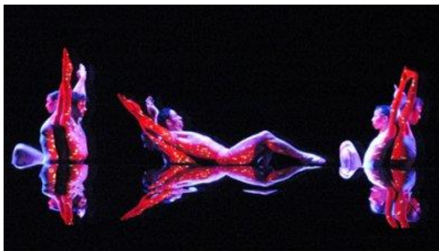
Photogramme de l'extrait Crucible chorégraphie de Alwin Nikolais, 1985, https://www.youtube.com/watch?v=4KFpcO0f89E