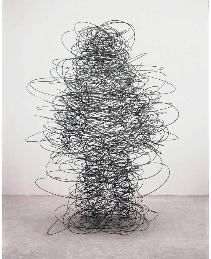
Antony Gormley, Feeling Material I, 2003, 205 × 154 × 128 cm