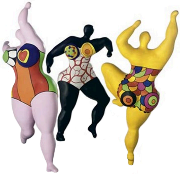
Niki de Saint Phalle, Les trois Grâces, 1999, 260 cm