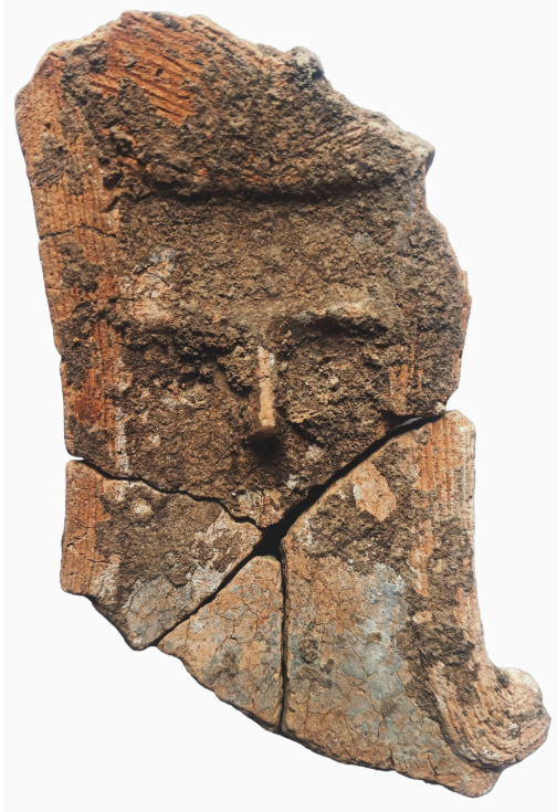
Figurine néolithique trouvée à Montpellier en 2022, datée entre 3900 et 3700