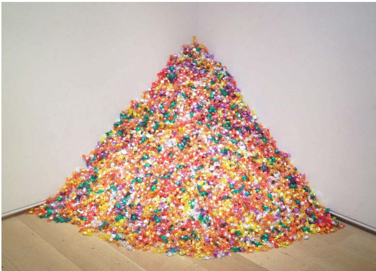
Félix González-Torres, Tas de bonbons, 1991