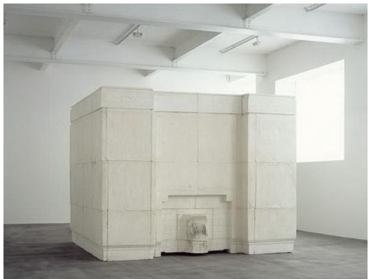
Rachel Whiteread, Ghost, 1990, 269 x 355.5 x 317.5 cm