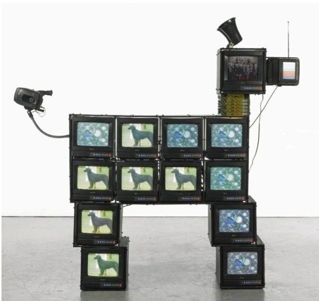
Nam June Paik, Watchdog, 1996, 173 × 165 × 43 cm