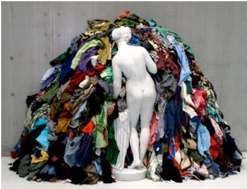
Michelangelo Pistoletto, la Vénus aux chiffons, 1967, 190 x 250 x 50 cm