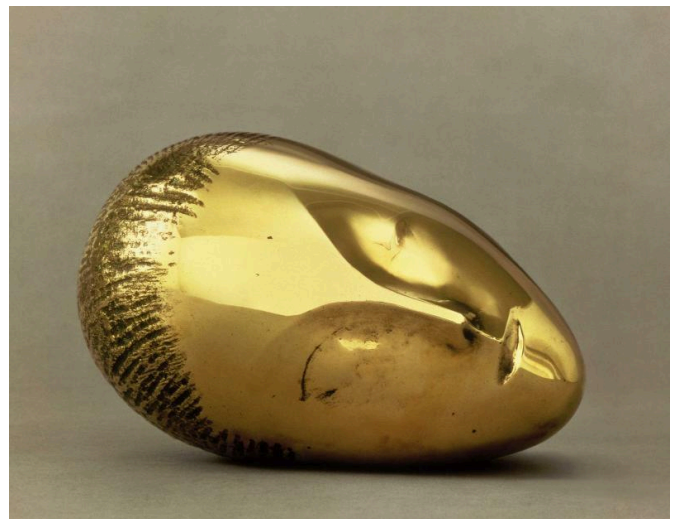
Constantin Brancusi, la Muse endormie, 1910, 16 x 27,3 x 18,5 cm