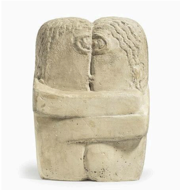
Constantin Brancusi, Le Baiser, vers 1920, 36,2 cm