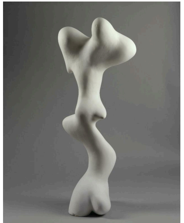
Jean Arp, Croissance, 1938, 109 x 36 x 43,5 cm