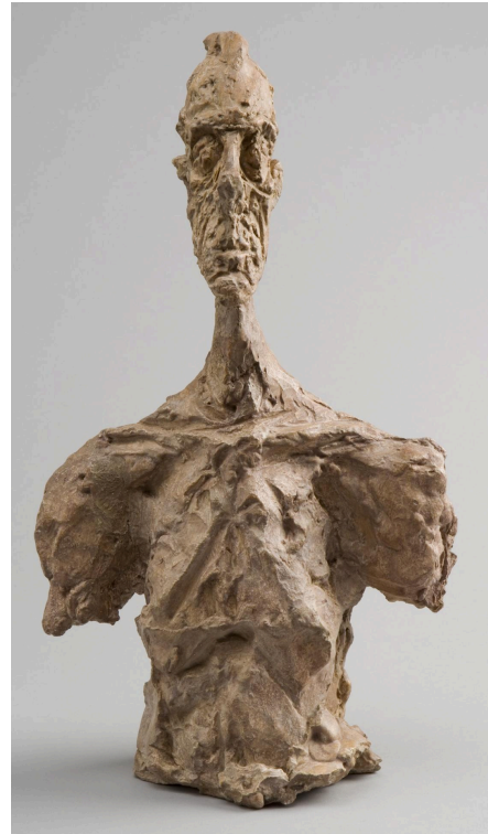
Alberto Giacometti, Buste de Diego, vers 1956, 37,3 x 21,5 x 13 cm