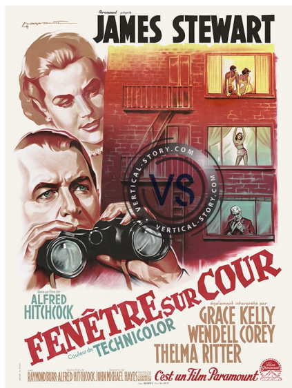
extrait filmique de Fenêtre sur cour d'Alfred Hitchcock 1954

- S'appuyer sur le dispositif d'enseignement comme « la classe-dehors » sur le blog: http://blog.inspe-bretagne.fr/arts-plastiques-m1m2/?s=classe+dehors ou bien l'aménagement de la salle de classe comme lieu d'investigation, sur le site académique bleu cobalt : https://pedagogie.ac-rennes.fr/spip.php?article469 ou https://eduscol.education.fr/document/18304/download