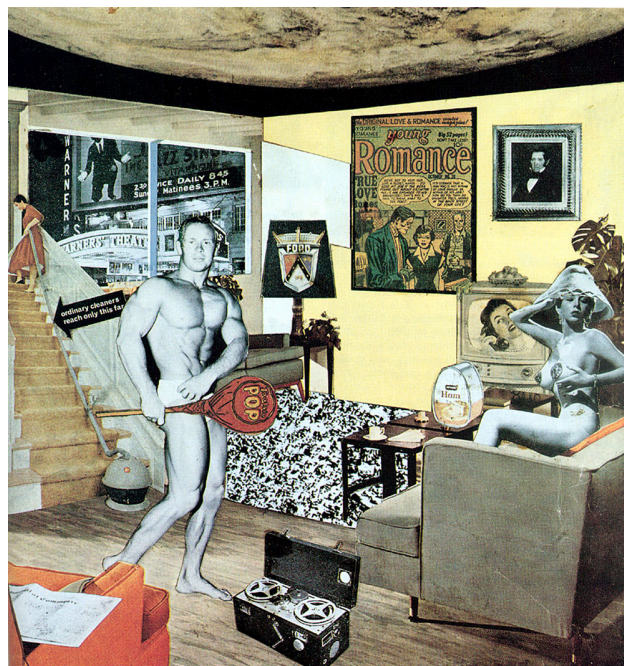
Richard Hamilton - qu'est -ce qui rend nos foyers d'aujourd'hui si différents si séduisants – photomontage 1956